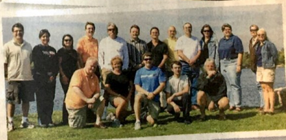
▲網上中學的導師均持有安省教育認證，教學水平獲當地教育局肯定。