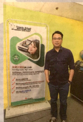
▲Alan 指，學生可選擇一對一或一對四真人實時教授模式，在導師指導下汲取新知識。